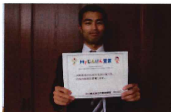
○株式会社Myじんけん宣言