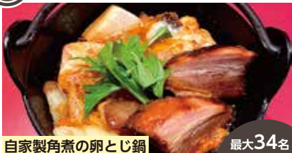
自家製角煮の卵とじ鍋 最大34名

肉・魚介・野菜など約80種類を常時揃える串揚げ専門店。地元の素材も沢山使用しております。店主厳選こだわりの地酒・焼酎も各20種類以上の豊富な品揃え！