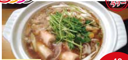
きりたんぼ鍋 最大48名

秋田川反漁屋酒場秋田本店では、ここ一軒で秋田県を楽しんでもらえるように、地酒、郷土料理、旬の秋田の魚、野菜料理を多数をご用意しております。