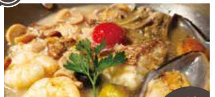
本日の鮮魚のアクアパッツァ 最大40名

アンティーク調にこだわった内装の落ち着いた店内。パスタを中心としたイタリアンとワインが楽しめます。21種類の麺から選べるのも特徴です。