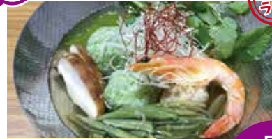
グリーンカレーかやき 最大50名

秋田かやき四天王も受賞したグリーンカレーかやき！しよつるを使用した和風出汁がくせになります。秋田を感じられる一品です。