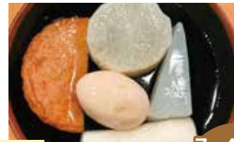
秋田おでん 7名 42席