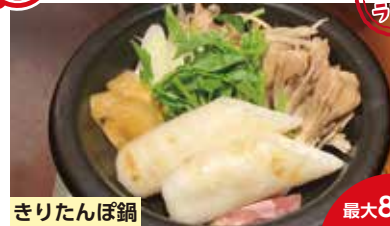
きりたんぼ鍋 最大80名

新鮮な鶏・豚を備長炭でじっくり焼き上げた炭火焼は絶品、人気ナンバー1の炊き餃子もおすすりです。秋田の郷土料理きりたんぼ・いぶりがっこなどもあり、地酒も取り揃えております。