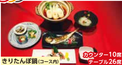
きりたんぼ鍋(コース内) カウンター10席 テーブル26席

厳選された旬の食材や、秋田の郷土料理をご堪能頂けます。各鍋はコースのみでのご提供となります。【きりたんぼコース】3,300円(前菜盛り、お造り、ハタハタ唐揚げ、きりたんぼ鍋、稲庭うどん)