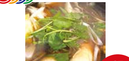
きりたんぼ鍋 最大37名