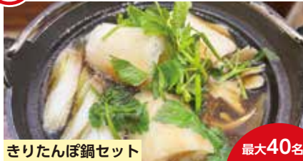
きりたんぼ鍋セット