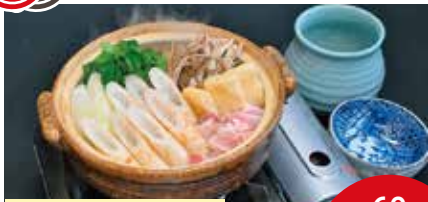
きりたんぼ鍋(二人前より) 最大60名

秋田市大町にあるアルパートホテル1階日本料理店。落ち着いた和の雰囲気でご宴会はもちろん、ご法事やお祝い事など幅広いシーンでご利用いただけます。