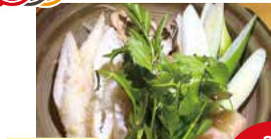
きりたんぼ鍋 最大32名

新鮮な魚、郷土料理、豊富な秋田県の地酒をゆったりとした店内でお楽しみいただけます。