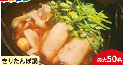
きりたんぼ鍋 最大50名

地元の食材をふんだんに使用した郷土料理と、比内地鶏のだしがよく効いたきりたんぼ鍋。10月から新米のあきたこまちを使用しております。秋田弁での紙芝居もとても好評です！