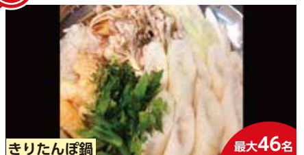
きりたんぼ鍋 最大46名

一本一本手打ちの大きい焼き鳥が自慢のお店です。お鍋付きの宴会コースなどもございますので、お気軽にお問い合わせ下さい。