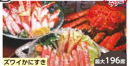
ズワイかにすき 最大196席

当店はアトリオン12階から、秋田市街を見渡しながら美味しい「かに料理」をご堪能いただけます。窓の外には太平山の姿も広がっており、季節ごとに移り変わる景色は、四季折々の美しさをお楽しみいただけます。是非、札幌かに本家秋田店のお料理と景色で五感を満たしつつ、特別な時間をお過ごしください。