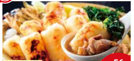
きりたんぼ鍋 最大56名

比内地鶏生産責任者の店。スープの取り方にとことんこだわったきりたんぼ鍋。新鮮な比内地鶏を備長炭で焼き上げる焼き鳥。だし・肉・卵、全て比内地鶏を使用した親子丼を提供させていただきます。