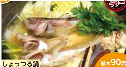
しよつる鍋 最大90席

なまはげ様が入り口に立つ、一軒家。囲炉裏を囲んだカウンターやお膳を使用したお座敷が田舎を思わせる空間を醸し出す。秋田の郷土料理や名物料理を取りそろえ、日本酒も豊富に揃っております。なまはげ様のイベントもあり、秋田を存分に楽しめます。