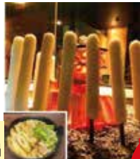
囲炉裏焼き きりたんぼ鍋 1～26名

最大26名様まで利用可能な完全個室をご用意しております。他にもカウンターやお座敷席も御座います。風情溢れる町屋造りの空間で心地よいひとときをお過ごしいただけます。