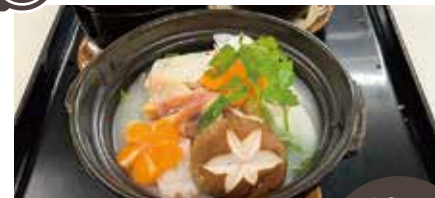
比内地鶏鍋(コース内)