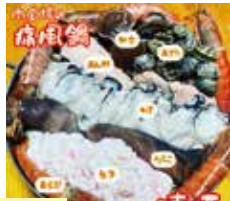
痛風鍋(二人前より) 最大20名

1年中楽しめる「まちなかキャンプ場」的なお店。冬は特設テントとストーブで「湯気を楽しむ」アウトドア料理の専門店。牡蠣、あん肝、白子など、プリン体がたっぷり入った「痛風鍋」が人気！