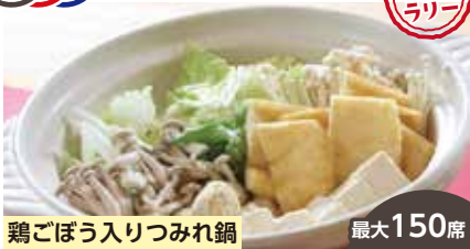
鶏ごぼう入りつみれ鍋 最大150席

人気の鶏ごぼう入りつみれ鍋の他、きりたんぼ鍋・だまご鍋・海鮮寄せ鍋などを提供しております。