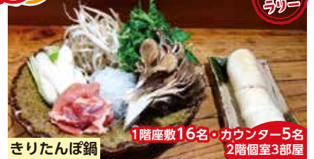
きりたんぼ鍋 1階座敷16名・カウンター5名 2階個室3部屋

秋田の「本物の味」を味わっていただきたく、手造りで納得のいくまでこだわりました。ひと味違うおいしさをお楽しみください。