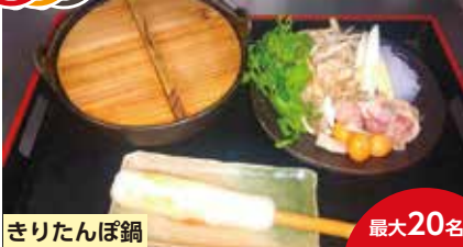
きりたんぼ鍋 最大20名

古民家風の囲炉裏を囲んでカウンター席メイン、郷土料理中心、市場より旬の野菜、魚も多数取り揃えております。カウンター内、囲炉裏の炭火焼きで鰯塩焼き、比内地鶏の串焼き等お召し上がり下さい。秋田の地酒も多数取り揃えております。いろり家一軒で秋田を是非楽しんでください。