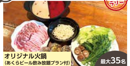
オリジナル火鍋 (あくらビール飲み放題プラン付) 最大35名

世界大会で数々の受賞歴がある秋田を代表する地ビール「秋田あくらビール」直営の飲食店です！県産食材を使用したビールにあう料理はもちろん、冬季限定の火鍋もこの機会にぜひお楽しみください！