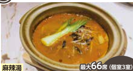
麻辣湯 最大66席(個室3室)

香港のコロニアル風インテリアをイメージした高級感あふれる中国料理レストラン。伝統的中国料理とモダンシノワを融合させた広東料理には、秋田の旬の食材を使用しています。