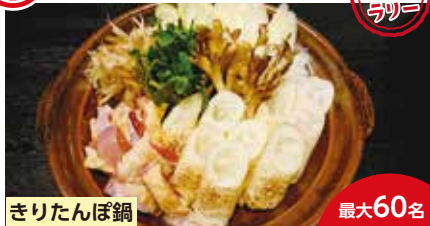
きりたんぼ鍋 最大60名

「エリアなかいち」の商業棟2Fにある和食店です。店内には絵画や焼物も飾っており、ゆっくりとお食事が出来ます。千秋公園、ミルハス、秋田県立美術館にお越しの際は是非お立ち寄りください。