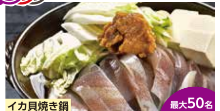
イカ貝焼き鍋 最大50名

家族で営業しています。お客様にはアットホームで落ち着く雰囲気があると良く言われます。宴会場もありますので、団体様のご宴会も承ります。皆様のご来店お待ちしております。