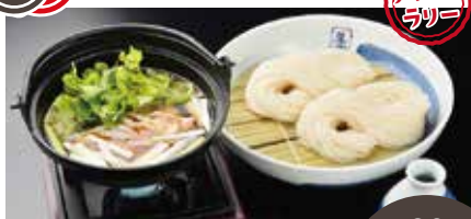
あったか比内地鶏つけうどん 最大80席

創業160有余年の歴史と伝統のある佐藤養助の稲庭うどんを秋田の玄関口でたくさんのお客様にお伝えたく、豊富なメニューを御用意しております。