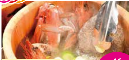
男鹿半島の石焼き鍋 最大46名

秋田県男鹿市と連携提携を結び、豪快な漁師料理の数々に加え市の観光地、文化、歴史、自慢の食材、特産品等の魅力を広く発信するアンテナ居酒屋でございます。