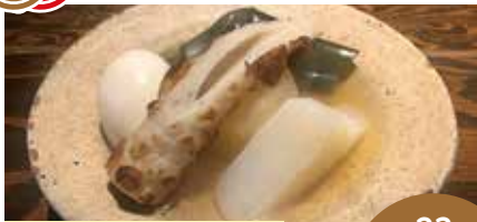
女将おまかせおでん5品盛 最大23席

■当店自慢のおでん出汁は「秋田県白神山地の伏流水」と「男鹿の天然のお塩」「北海道産、羅臼昆布」「鹿児島産、枕崎の鰹節」隠し味に「秋田県にかほ市の鱈のしよつる」を使用しております。■一次会でも、二次会でも、楽しんで頂けるお店です。暖簾を潜ってお気軽にお越し下さい。