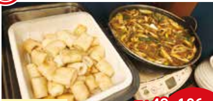
きりたんぼ鍋 最大49卓106席

秋田名物のきりたんぼ鍋や特産のジュンサイ、ギバサの他、作りたておにぎり、自身でアレンジできる卵かけご飯などが楽しめる朝食ビュッフェ。