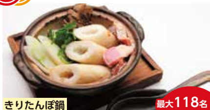
きりたんぼ鍋 最大118名

稲庭うどん製造メーカーの直営店。本場の稲庭うどんメニューは常時20種類以上を提供。その他、比内地鶏・はたはた・ぎばさなど、秋田の食材を使った一品料理も味わえるお店です。