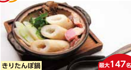
きりたんぼ鍋 最大147名

当店は「稲庭うどん」をメインに季節の食材やハタハタ・きりたんぼなど秋田の郷土料理を提供しております。カウンター席もごございますので、おひとり様でもお気軽にご来店ください。