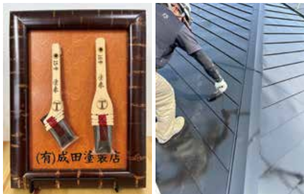
確かな技術で安心施工!

創業35年の実績のもと、豊富な経験で戸建・集合住宅から公共施設まで、あらゆる塗装の現場に対応します。一級建築塗装技能士が確かな技術で責任をもって施工します。また、完全自社施工のため安心価格でご満足をお約束いたします。お家やアパートの屋根・壁をはじめ、塗装に関する様々なお困りごとを解決します。点検は無料となっておりますので、お気軽にお問合せください。