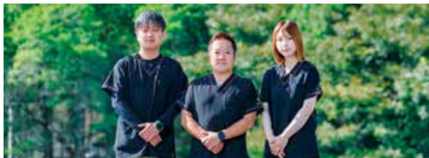
看護経験豊富なスタッフ

医療保険・介護保険どちらでもご利用可能な他、一般看護だけでなく、人工呼吸器管理・中心静脈栄養法など、専門的な知識と技術を24時間提供可能な訪問看護ステーションです。利用者様にとって最良の在宅看護サービスをご提案、ご提供いたします。お気軽にお問合せください。