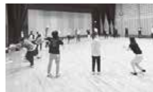
トレーニングの様子

研修後半ではチームに分かれて演劇を体験。芝居作りからチームで力を合わせて取り組み、発表では各チームとも研修を通じて学んだ成果を存分に発揮し演じた後、お互いにフィードバックを行った。