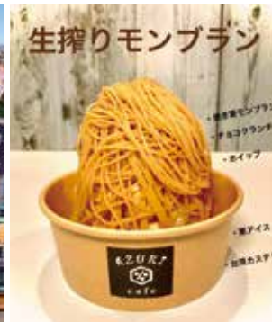
一番人気のモンブラン