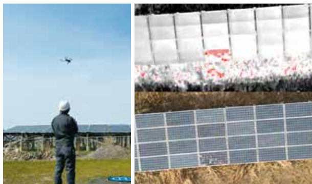
温度差の比較で異常推定箇所の検出が可能です!

屋根や外壁等の劣化診断、太陽光パネルの点検等のコスト削減にご興味はありますか? 当社では、赤外線ドローンを活用した点検事業を実施しており、有資格者が赤外線画像の解析を行います。また、任意点検のみならず、特定建築物等の法定点検等にも活用することができ、お見積り作成は無料です。比較・検討により大幅なコストカットが実現できる可能性がありますので、お気軽にお問合せ、ご相談ください。