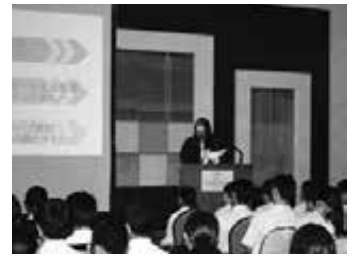
セミナーでの自社PR