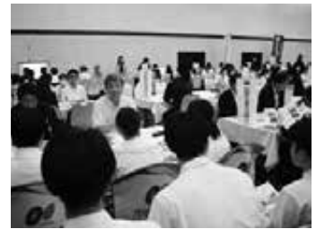
情報交換会の様子