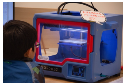
立体物を制作できる 3D プリンター (要予約・有料)