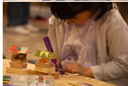
写真左:今回「ソウゾウカンラボ」が設置されるスペース。今後、サインや素材が追加されます。 写真右 2 枚:今年度ゴールデンウィークに行われたイベント「ソウゾウカンラボ」のようす。