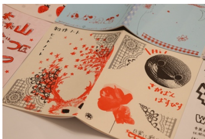
味わいある印刷が特徴的なリソグラフ印刷機 (一部要予約・有料)