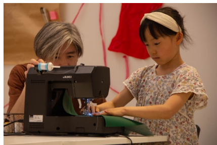
会場にある布はもちろん素材の持ち込みも可能 (要予約・有料)

気軽な作業はもちろん、リソグラフ印刷機や 3D プリンター・マシンを使った創作も可能。